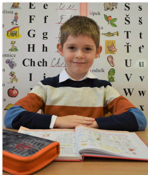
Můj první školní rok 2022/2023