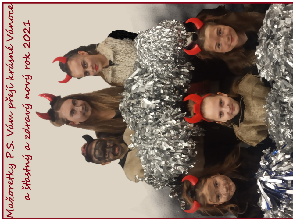
Mažoretky P.S. Vám přeje krásné Vánoce a šťastný a zdravý nový rok 2021