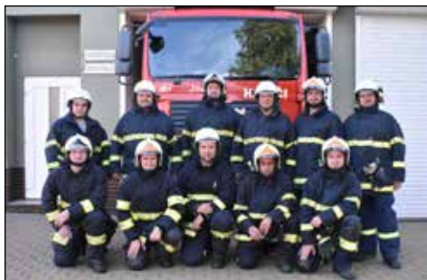
Část zás. jednotky