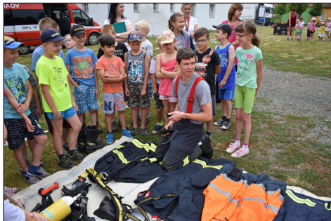
ukázka ZŠ a MŠ