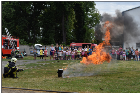
ukázka ZŠ a MŠ

Mlýnkách. Tehdy měly naše děti zcela unikátní možnost si za asistence hasičů vyzkoušet hašení “požáru“ pomocí proudnice typu C a vysokotlakého proudu, a zároveň být mezi prvními, kteří nahlédnou do naší nové cisterny typu CAS 15 MAN. Tuto cisternu, která k nám přijela 23. 7., již máme od 17. 8. zařazenou ve výjezdu a rozhodli jsme se jí pokřtít jménem Josef, na památku našeho nedávno zesnulého velitele. Toto auto sloužilo u druhovýjezdové jednotky v Požární stanici Hodonín po dobu 9 let. V základní výbavě obsahuje nádrž na vodu o objemu 2000 l a nádrž na pěnidlo o objemu 120 l, motorovou řetězovou pilu, elektrocentrálu o výkonu 5 kW, přetlakový ventilátor, plovoucí čerpadlo, motorové čerpadlo a mnoho dalších potřebných věcí při řešení mimořádných událostí. Naše “stará“