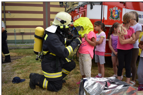
ukázka ZŠ a MŠ