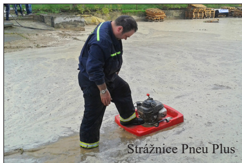
Strážnice Pneu Plus

a 8 technických zásahů. Oproti loňskému roku, kdy jsme měli celkem 11 událostí, si pro nás tento rok připravil plno zkoušek a zcela unikátních zásahů. Ačkoliv si většina lidí při vyslovení slova hasiči představí spíše požáry, letos nám nejvíce daly zabrat právě bouřky. Jednou z největších událostí pro nás bylo květnové čerpání vody ve Strážnici. Tehdy déšť spláchl vodu z polí a vytopené byly sklepy pod rodinnými domy po celé Strážnici. Okolní dědiny zůstaly nedotčeny. Pro srovnání: v Petrově napršelo 26 l/m 2 , ve Strážnici 60 l/m 2 . Že se jednalo o unikátní událost, nám potvrdil i jeden místní pamětník, který celý život strávil v tomto městě a nic podobného nepamatuje. Tehdy vítr doprovázející tuto bouřku vzal i střechu z Komerční banky. Těto mimořádné události se účastnilo celkem 14 jednotek, a to včetně jednotek, které jsou předurčeny k ochraně obyvatelstva, a zasahujícím hasičům dělaly týlové zázemí. Z naší jednotky zde zasahovalo 9 hasičů. Další unikátní a pro nás