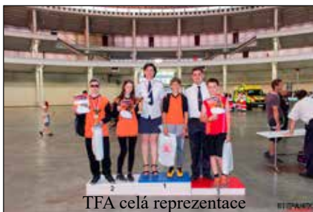
TFA celá reprezentace