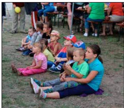
Otevírání přístavu