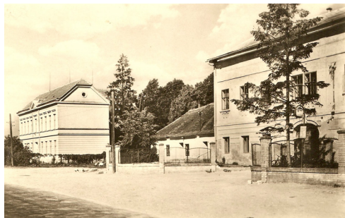
Stavba z roku 1908