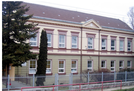
foto škola současnost