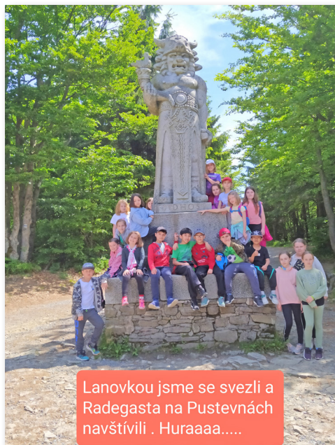
Lanovkou jsme se svezli a Radegasta na Pustevnách navštívili . Huraaaa.....